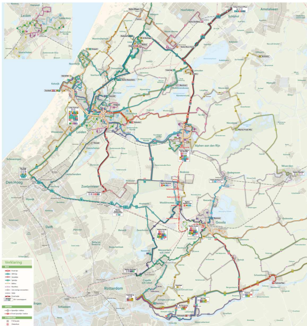
Kaart 3: OV-lijnnennet ZHN 2019 (gekleurde lijnen zijn buslijnen, gestreepte lijnen zijn raillijnen).

In onderstaande figuur is het huidige OV-netwerk weergegeven.