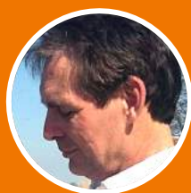
AAD DE KOOL Achthuizen